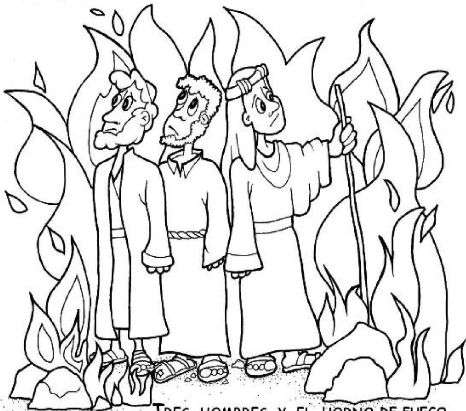
TRES HOMBRES Y EL HORNO DE FUEGO. DANIEL 3