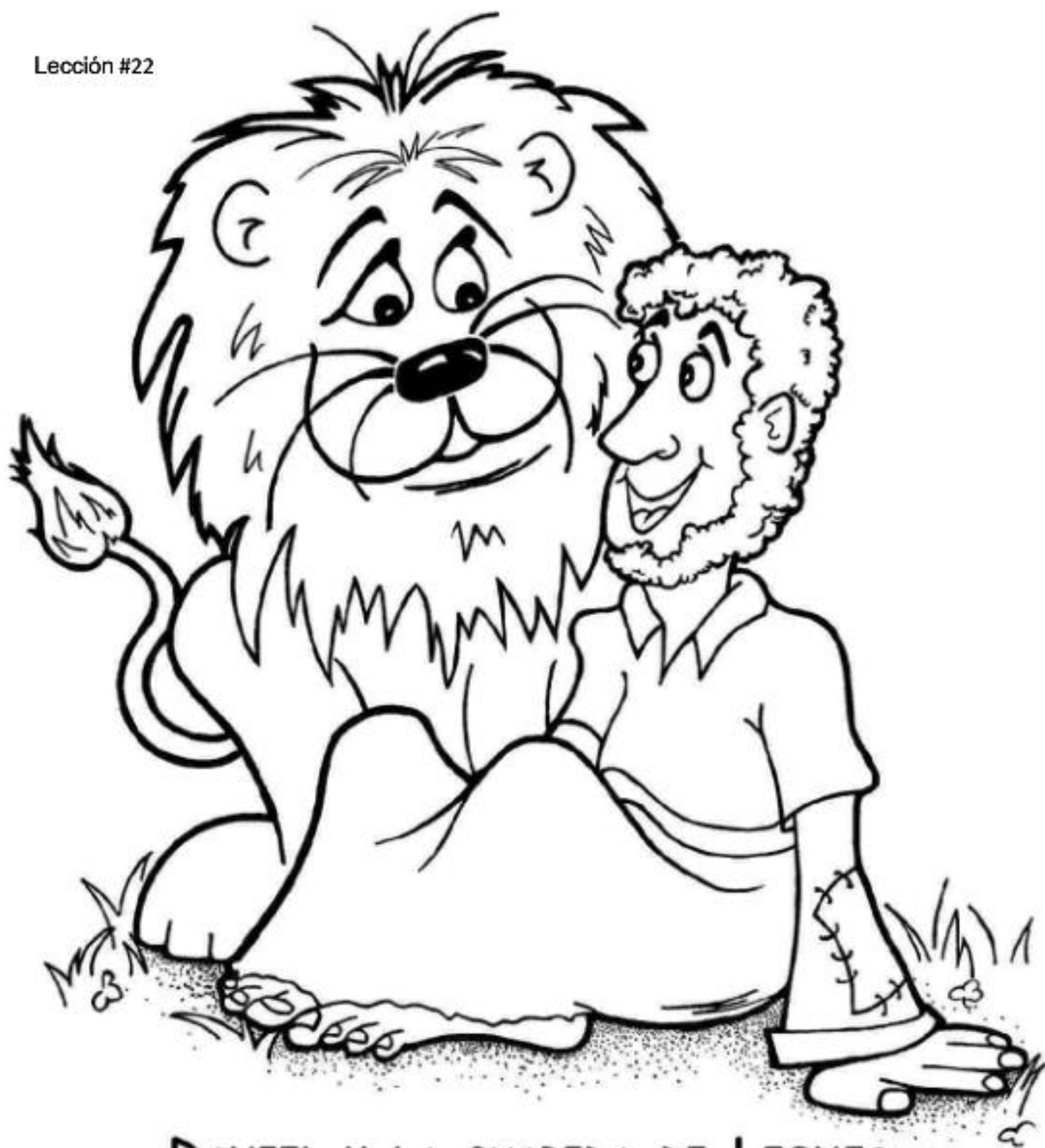
DANIEL Y LA GUARIDA DE LEONES. DANIEL 6: 1-28