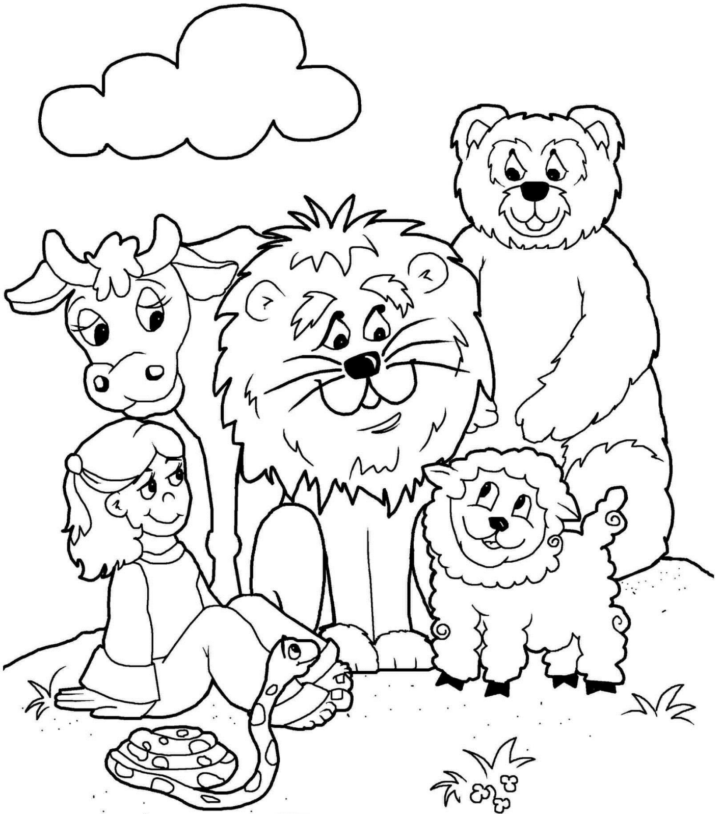
IMAGEN DEL CIELO ISAÍAS 11: 6-9